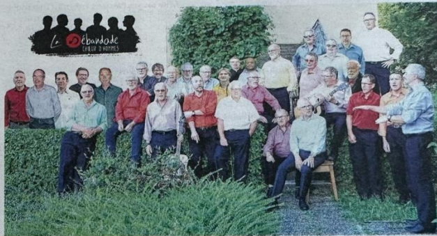
Voilà déjà trois grandes et belles décennies que le chœur d'hommes La Débandade enchante les scènes de la région et au-delà.

L'aventure ainsi lancée, le répertoire s'est élargi, la confiance s'est renforcée. Chansons françaises et étrangères, chants sacrés, c'est sous