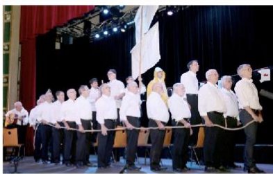
Besançon • Le chœur des hommes La Débandade fêtera ses trente printemps au Grand Kursaal les 19 et 26 novembre