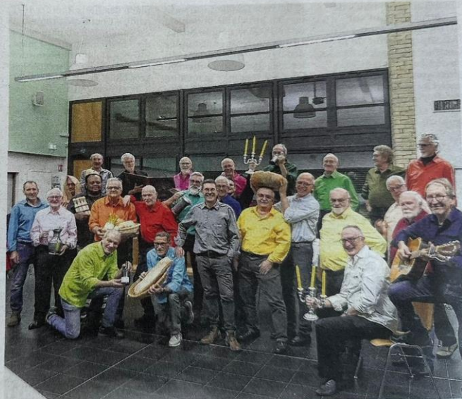
Éternels enfants, il suffit d'une idée pour que les « gars » de la Débandade vous entraînent dans leur univers fait d'amitié, de chants et de générosité.

Grand Kursaal, 19 et 26 novembre, 17 h. Tout public. Tarif : 14 € (gratuit pour les moins de 12 ans). Réservation : 06 31 79 16 56 - 06 52 13 21 06 www.la-debandade.fr