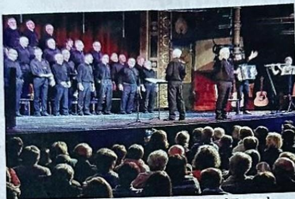
L'un des concerts de La Débandade au Grand Kursaal pour les 30 ans du chœur d'hommes.

Une belle année pour la Débandade, avec comme point d'orgue les deux spectacles donnés au Grand Kursaal de Besançon pour célébrer les 30 ans du chœur d'hommes de Franois. Le bilan est exceptionnel: plus de 1700