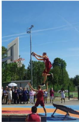
École-Valentin • Spectaculaire inauguration du terrain multisport