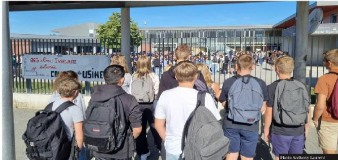
Doubs • Au collège Aubrac, 663 élèves ont effectué leur rentrée lundi. Malgré l'ajout il y a quatre ans de préfabriqués, les conditions d'accueil sont dénoncées par les enseignants