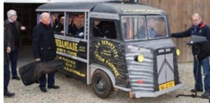
A vendre Vieux tube année 2015 du concert de La Débâdade